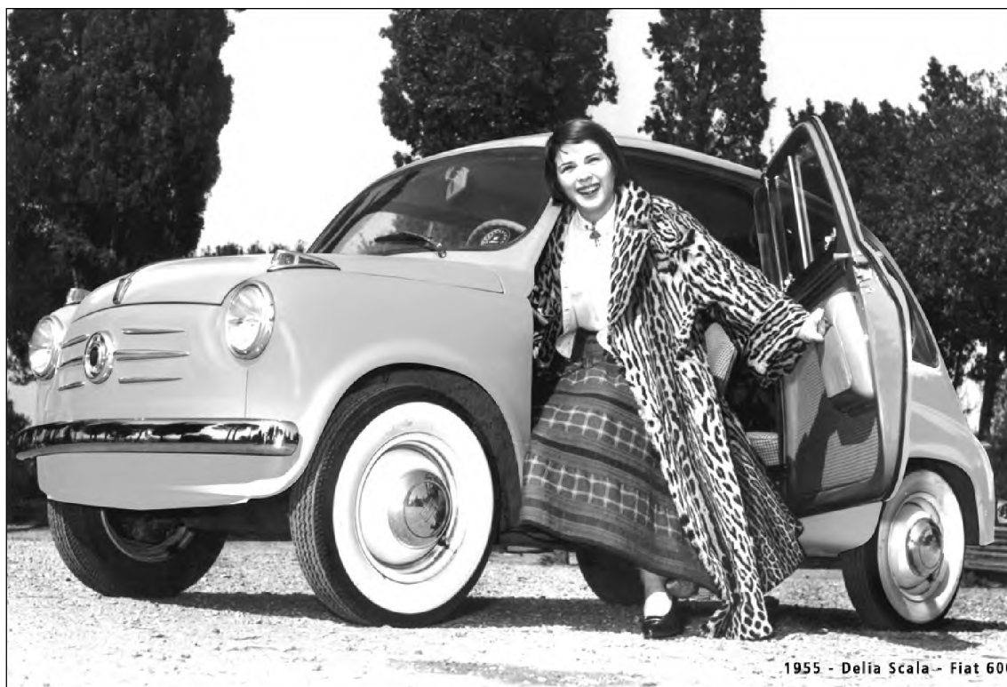
Sl. 1/ Fig. 1: Fiat 600 (1955).

(ej) nula – bog ne daj da greš na internet am pazit moraš kaj govoriš ... ej nula ; ita. non permettersi nulla , v pomenu nič si ne privoščiti