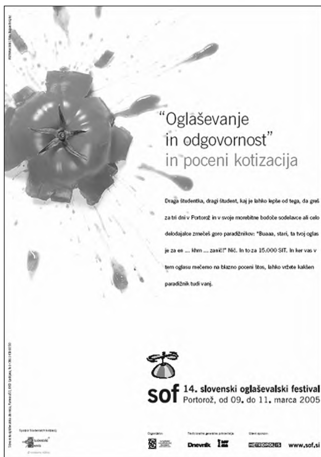
Sl. 5. Kvaziodgovornost oglaševalske industrije. 8 Fig. 5: Quasi-responsibility of advertising business.