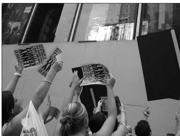
Sl. 2, 3, in 4: Simulirano oboževanje. 7 Fig. 2, 3 and 4: Simulated admiration.

nejasen. Pristop je učinkovit, saj prav z nakazovanjem, nedokončano zgodbo oz. zgodbo brez jasnega sporočila vzpodbudi potrebo po ustvarjanju smisla, razumevanju sporočila. Psihološki preskok smiselne interpretacije in razumevanja naj bi bil vzrok za to, da bo posameznik kupil sporočilo (Rushkoff, 2000). Tržne komunikacijske, predvsem oglaševalske kampanje, kot odgovor na izzive trenutnega komunikacijskega okolja uporabljajo tehnike ironije in samoironije, s katerimi (samo)ironizirajo pretekle medijske reprezentacije lastne blagovne znamke, določene trende ali problem medijske manipulacije in potrošništva oz. natančneje samega akta prodaje . Kot že rečeno, pa le do določene mere, skratka (razumljivo), nikoli res direktno in dokončno ne dekonstruirajo lastne blagovne znamke oz. sporočila oglasa, s tem pa se sicer na neki način "priklopijo" na relativno "medijsko osveščenost" ciljne skupine (Rushkoff, 2000). Povečanje televizijskih (programskih) vsebin, ki se ironično odzivajo na probleme potrošništva, globalizacije, kapitalizma, medijev in oglaševanja, imajo funkcijo "varovanja" oglasnih sporočil, od katerih televizijske postaje živijo. Marc Crispin Miller govori o cirkularni kulturni operaciji in ugotavlja, da televizija "brani" oglase pred zasmehovanjem (dekonstrukcijo) s tem, da že sama (s svojimi vsebinami) opravi vse zasmehovanje (Miller v Frank, 1997, 231).