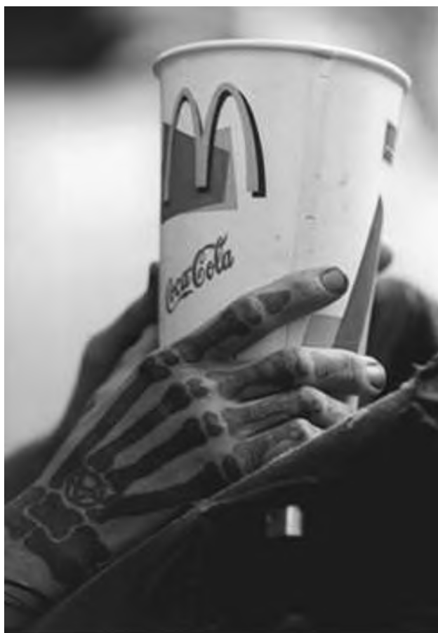
Sl. 10: Brez besed (lokidesign, 2006-03).