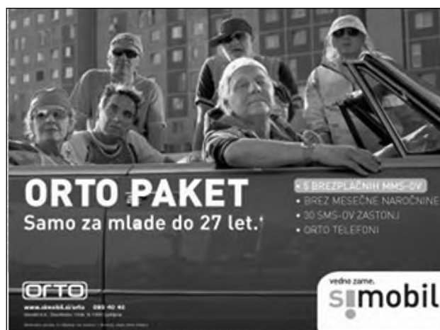
Sl. 8. Kul oglaševanje kot metoda tržne diferenciacije. 13 Fig. 8: Cool advertising as a method of market differentiation.

Metoda prevzema kulturne kritike z namenom prodajanja je še danes v svojem bistvu enaka. Še več, kritika odtujitve in razumevanje življenja, v katero posameznika interpelira današnja potrošniška družba, sta postala atributa, na katerih se gradi lojalnost potrošnikov