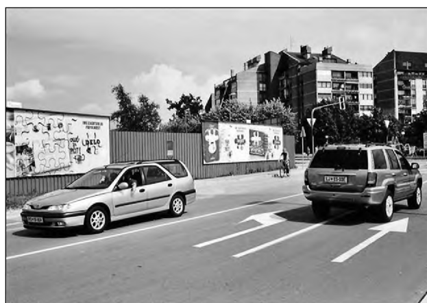
Sl. 6 in 7. Oglas za pitič! 9 Fig. 6 and 7: An ad to sting!

ni socialne države, ki je sicer zgodovinski dosežek delavskega razreda. Za nas je posebej zanimiv razvoj takrat mlade, izobražene in ambiciozne generacije mladih izobražencev, menedžerjev, ki so postali "umetniški kritiki" obstoječega birokratskega razosebljanja množične družbe.