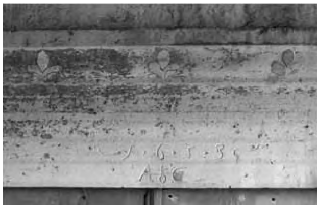
Sl. 7: Portal – detajl preklade z letnico in inicialkama A C.