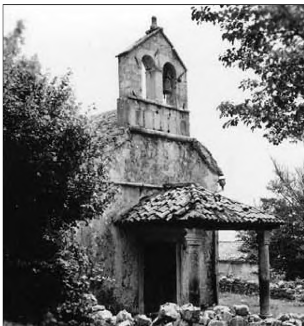
Sl. 9: Stanje cerkve leta 1968 (foto: Emil Smole, ZVKDS OE Nova Gorica).

Fig. 9: The church's state in 1968 (Photo: Emil Smole, Institute for the Protection of Cultural Heritage of Slovenia, Nova Gorica Regional Unit).