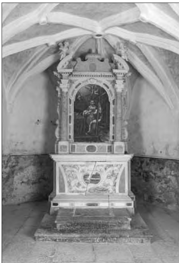
Sl. 8: Oltar iz leta 1744. Fig. 8: Altar dating to 1744.

ki jih je dajala v najem, od prodaje starih ovac in jagnjet, od pridelkov: volne, lanu, sira, meda, sena, pšenice, rži, soržice ( mixtura ) in vina ter od miloščine v denarju ali blagu. Ob koncu leta 1710, na primer, je po obračunu prihodkov in izdatkov ostalo v blagajni 337 lir, 1716. leta 404 lire, 1753. leta 509 lir, 1756. leta 1211 lir in 1763. leta 994 lir (ŽAV, 2).