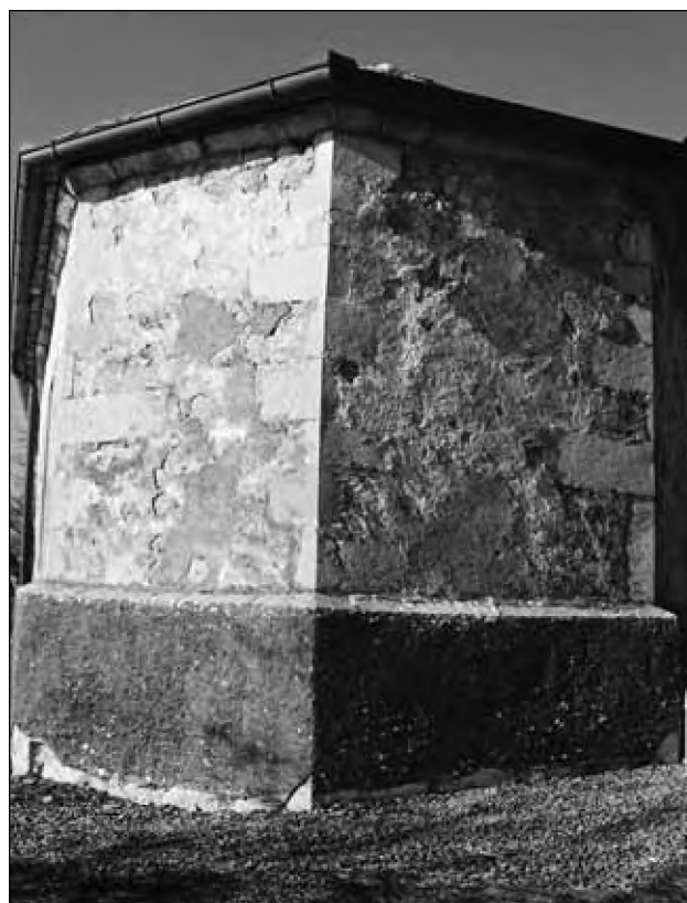
Sl. 4: Zunanjščina prezbiterija z značilnim gotskim pristrešenim talnim zidcem in šivanimi vogali.

iz grobe cementne malte. Iz ravnine stranskih fasad izstopa s pravokotnima zoboma, globokima 16 centimetrov. Ta zoba, ki nista zakrita z ometom, sta sezidana iz enakih klesancev kot stene ladje. Pri podrobnejšem ogledu spodnjih delov sten na stiku starejše ladje in mlajšega prezbiterija, kjer sta bila prvotna vogala ladje, opazimo manj pravilno zidavo in spremembo višin skladov iz polklesancev. Očitno je, da so pri dozidavi cerkve podrli tudi vzhodna vogala ladje, nastale vrzeli pozidali z manj kvalitetno obdelanim kamnom, klesane vogelnike pa smotno uporabili za dozidavo tistih novih delov, ki morajo biti iz klesanega kamna – med drugim tudi za oba zoba talnega zidca prezbiterija.