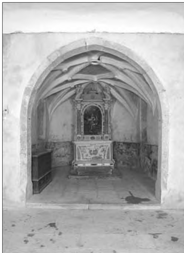
Sl. 5: Pogled v prezbiterij s slavolokom iz klesanega kamna.

nenavadnima ploščatima stiliziranimi rozetama, ki se v podrobnostih nekoliko razlikujeta med sabo, po simsu pa teče niz listnih okraskov, ki si sledijo v velikih presledkih. 10 Sočasno je cerkev dobila tudi dva para novih visokih pravokotnih oken s poševno posnetimi ostenji in železnimi križi. Dve izmed njih sta nadomestili prejšnji okni v stranskih stenah prezbiterija, tretje je razširilo in zvišalo prvotno tretje okno v južni steni ladje, četrto pa je na novo predrlo severno steno ladje. Nasadila na njihovih licih pričajo, da so nekdaj imela tudi oknice. Vsa okna so obdelana s krempačem in imajo rezane robove. Okni na severni strani sta nekoliko nižji in brez posebnosti, večji južni okni pa imata izrazitejše, nekoliko bolj izbočene zunanje in notranje robove lic, ki se s pokončnikov nadaljujejo do zunanjih robov preklade in spodnjega oknjaka.