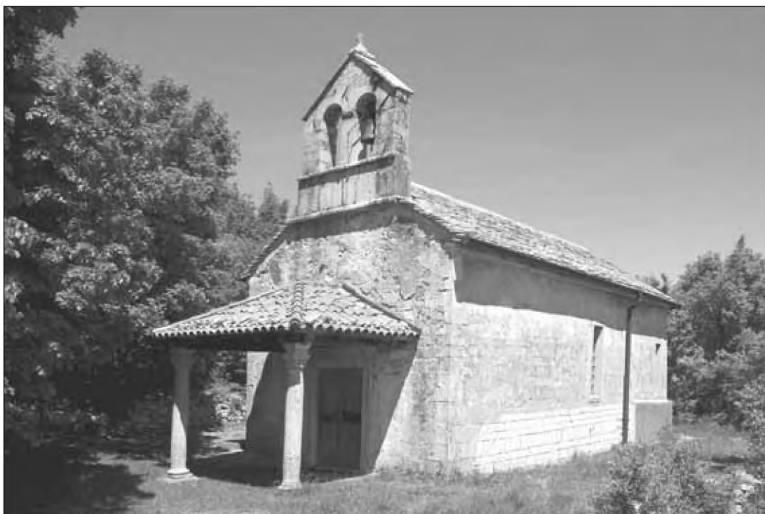
Sl. 1: Pogled na cerkev sv. Helene z jugozahoda. Fig. 1: A south-western view of St Helen's Church.

Cerkev stoji na položnem prisojnem pobočju hriba Škale tik nad vasjo. Obdaja jo razpadajoča snizka zidana kamnita ograda. Nekdaj so jo na zahodni strani zapirala železna vrata ali porton . Cerkvena ladja oblikuje s prezbitერიem, ki je triosminsko oz. tristransko zaključen, enovito kamnito stavbno lupino s strmo skrilnato streho. Oba prostora imata v južni in severni steni po eno pravokotno okno s poševno posnetimi ostenji. Zahodno pročelje s strmim zatrepom se vzpenja v zvončnico z dvema ločnima linama, zidano iz klesancev in pokrito z dvokapno strešico iz klesanih plošč. Cerkveni vhod v pročelju varuje trikapna korčasta streha lope ali klonice , ki jo podpirata dva stebra. S takšnim pročeljem, zvončnico in lopo se uvršča cerkev sv. Helene v ožjo družino cerkva, ki jo sestavljajo še cerkev Sv. Trojice v Dolnjih Ležečah ter cerkvi sv. Tomaža v Famljah in sv. Križa v Škofljah. 2 Izmed njih je edina ohranila skrilnato streho na ladji in prezbitერიju, medtem ko so bile druge prekrite s korci – razen lope cerkve v Dolnjih Ležečah, ki je tudi še krita s skrilami.