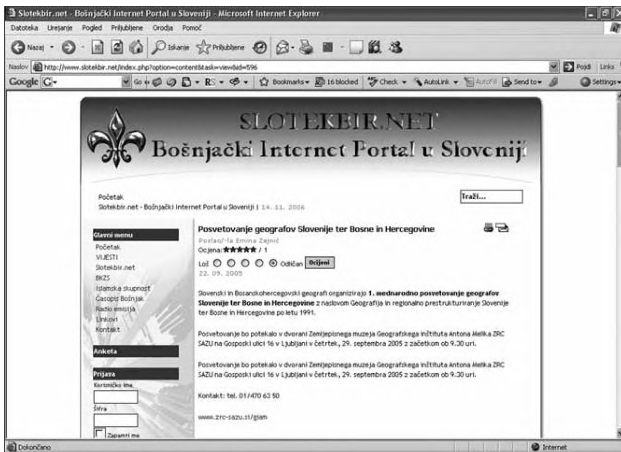
Sl. 3: Spletna stran bošnjaškega portala v Sloveniji obvešča o dogodku visokega pomena (najvišja ocena), ki vabi na obisk prvega mednarodnega posvetovanja geografov Slovenije ter Bosne in Hercegovine. (Vir: SLOTEKBIR, 2006). Fig. 3: Website of the Bosniak portal in Slovenia reporting on a major event (highest rating), inviting visitors to the first international conference of geographers of Slovenia and Bosnia and Herzegovina. (SLOTEKBIR, 2006).

Prisotnost Bosne in Hercegovine ter njene reprezentacije na različnih spletnih mestih slovenskega dela svetovnega spleta smo ugotavljali s pomočjo analize števila in strukture zadetkov v slovenskem jeziku, in