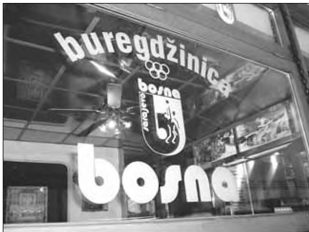
Sl. 2: Del pestre kulinarčne ponudbe v Sarajevu.

Poleg obstoječe ponudbe lahko opazimo tudi neizkoriščene ali slabo izkoriščene možnosti v turističnem oglaševanju in trženju. Izpostaviti velja predvsem zimski turizem, ekoturizem in pohodništvo ter številne kulturne destinacije iz nekdanje skupne zgodovine (SFRJ), ki bi privabljale potencialno močno skupino t. i. "jugonostalgikov".