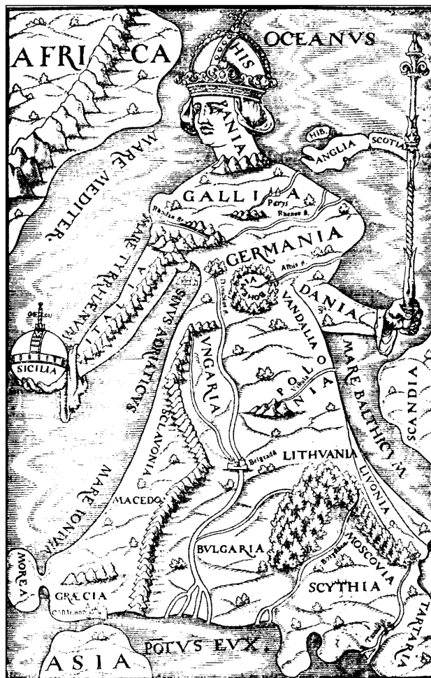
Sl. 1: Podobe združene Evrope – Münstrov pogled na kontinent kot izhaja iz njegovega dela Cosmographia Universalis (Münster, 1588 v Heffernan, 1998).

francoski politični cilj, ki naj se udejanji s posebno zvezo med Francijo in Nemčijo, saj bi razvoj medsebojnih tesnih vezi onemogočil nove konflikte med državama. Povezovanje bi se lahko po Schumanu pričelo z združevanjem "celotne francosko-nemške proizvodnje premoga in jekla, ki bi jo skupaj upravljali v interesu drugih evropskih držav". Ideja je dobila podporo francoskih politikov, ki so v tem povezovanju videli možnost uveljavitve francoskih interesov v Evropi, evropskih federalistov, a tudi tistih držav, ki niso bile najbolj nagnjene britansko-amerškemu pokroviteljstvu kontinentalne Evrope. Po drugi strani je bila pobuda o povezovanju kot dejavniku gospodarske modernizacije, ki je v bistvu prevzemala Churchillovo idejo iz leta 1943, pogodbo tudi Američanom v luči njihove funkcionalistične strategije (Heffernan, 1998).