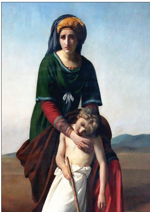
Slika 6 : François-Joseph Navez, Hagara in izmael v puščavi (izrez), 1820.