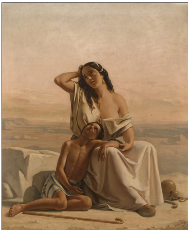
Slika 8: Luigi Alois Gillarduzzi, Hagara in Izmael v puščavi, 1851 (Wikimedia Commons).

opraviti z lastnim sinom, ne na tem ne na prihodnjem svetu.