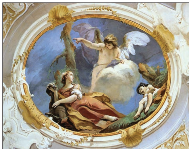
Slika 5: Giambattista Tiepolo (Giovanni Battista Tiepolo), Hagara v divjini. Stropna freska v Palazzo Patriarcale, Udine, 1726–1729.

Iz navedb Abrahamove starosti ob rojstvu prvega sina Izmaela (86 let) in drugega sina Izaka (100 let) je razvidno, da je Izmael ob Izakovem rojstvu imel 14 let. Ko je Sara dobila svojega biološkega sina Izaka, takrat je po besedah Jožefa Flavija imela 90 let (prim. Flavius, 1978, zv. 4, 104–105), pa je v njej vzplamtelo negativno čustvo do Izmaela in povzročilo silen družinski konflikt: