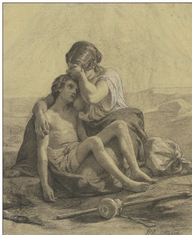
Slika 7: Johann Heinrich Hasselhorst (1825–1904), Hagara in Izmael.

Louis Ginzberg v prvem zvezku svoje zbirke The Legends of the Jews alegorizaciji družinske zgodbe očaka Abrahama posveti največ pozornosti v petem oddelku z naslovom »Abraham« (Ginzberg, 2003a, 167–249). Za to zbirko judovskih legend je značilno,