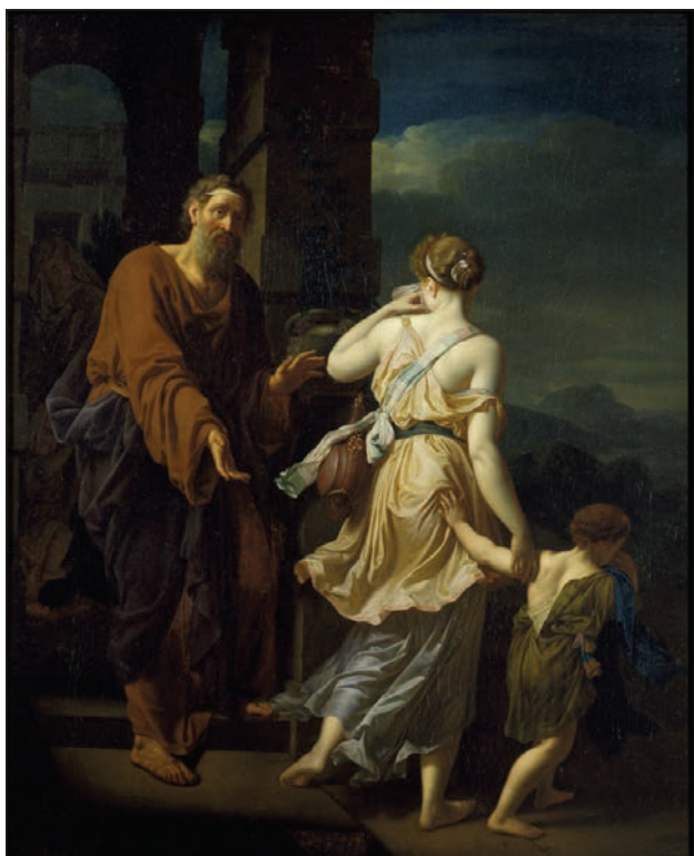
Slika 4: Adriaen van der Werff, Izgon Hagare in Izmaela, 1699.

kako se je Gospod prikazal Abrahamu in mu dal nepričakovano obljubo: »Gotovo se vrnem k tebi čez leto ob tem času, in glej, tvoja žena Sara bo imela sina.« (1 Mz 18,10) Ta obljuba je pomenila napoved čudeža, ker sta bila Abraham in Sara že v letih in Sara ni več mogla gojiti upanja na otroka. Zgodba v 1 Mz 21,1-21 se navezuje na to napoved čudeža in se glasi: