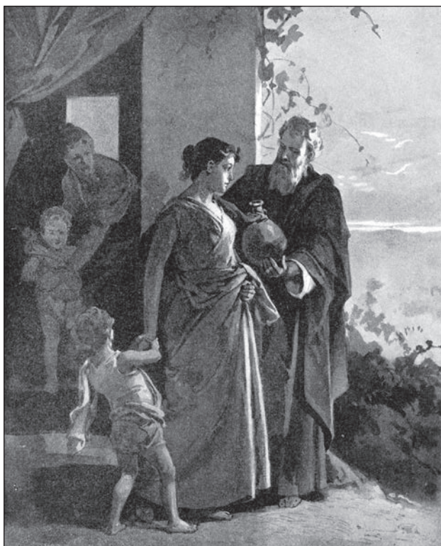
Slika 2: Abraham pošlje Hagaro stran od svojega doma, Svetopisemska ilustracija iz leta 1897 (Anonimni slikar, Wikimedia Commons).

predstavlja skupni izvor treh svetovnih religij in civilizacij – judovstva, krščanstva in islama – in ima zato od vseh judovskih pripovedi še posebej izpostavljeno »politično funkcijo«. Tako Judje, kristjani kot tudi muslimani namreč opisujejo svoj izvor s tesnim sklicevanjem na pripoved o Abrahamu, vključno z zapleteno zgodbo o Abrahamovem odnosu s Hagaro. Kritična analiza vidikov, ki so jih dosedanji raziskovalci izpostavljali v vrednotenju razlogov za aktualnost tega besedila, omogoča presojo vprašanja, kateri dejavniki so najpomembnejši v procesu judovskega spreminjanja paradigem v politični aplikaciji še posebej aktualnih svetopisemskih besedil.