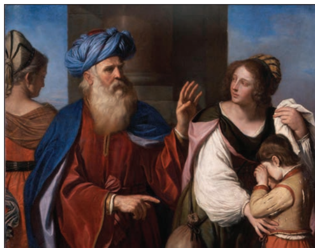
Slika 3: Guercino (Giovanni Francesco Barbieri), Abraham izžene Hagaro in Izmaela, 1657 (Wikimedia Commons).

Žena Saraja Abram u ni rodila otrok. Imela pa je egiptovsko dekle, ki ji je bilo ime Hagara. Saraja je rekla Abram u: »Glej, Gospod mi je odrekel otroke. Pojdi k moji dekli, mogoče dobim po njej potomstvo.« Abram je poslušal Sarajo.