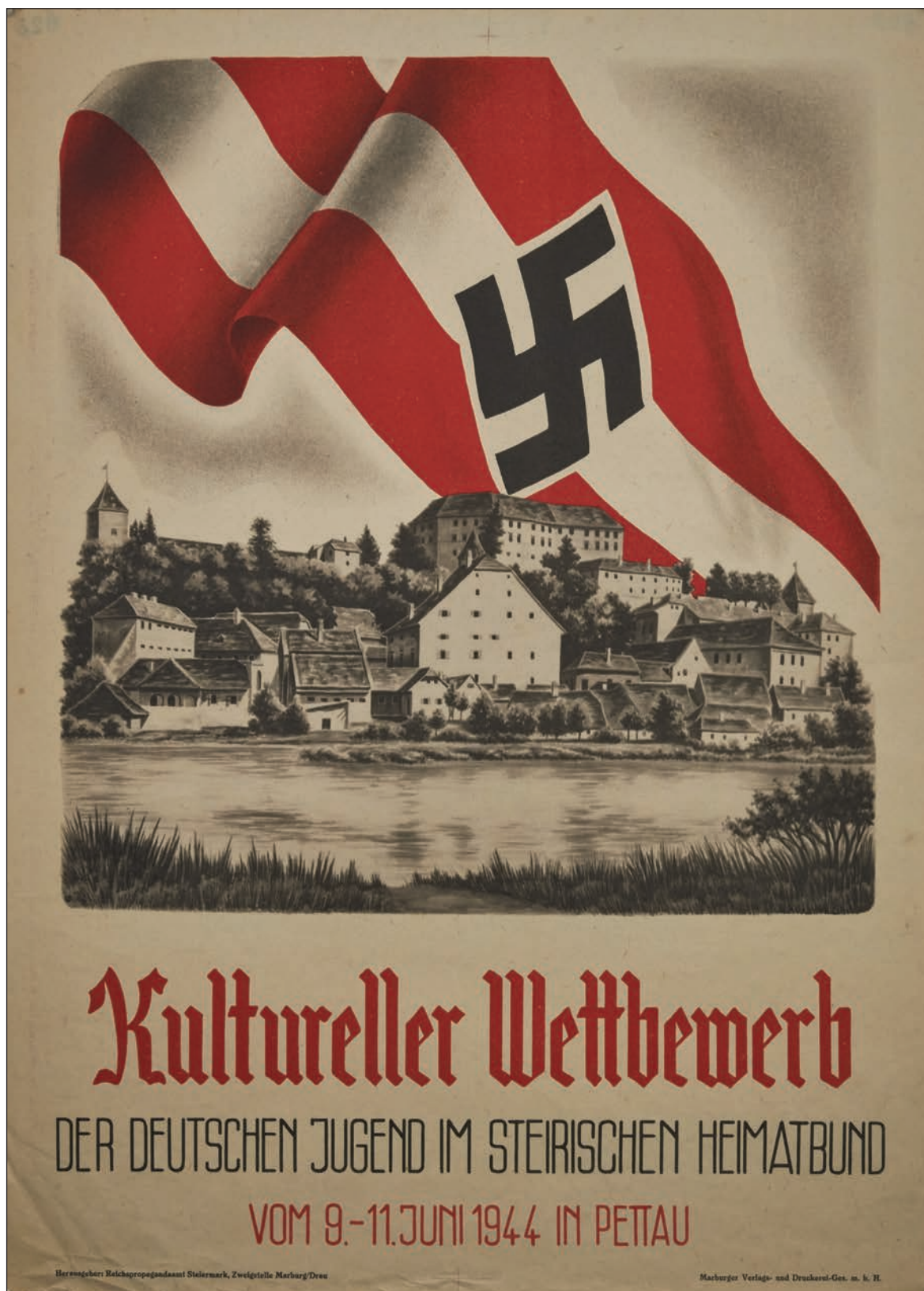
Slika 3: Plakat Štajerske domovinske zveze ob kulturnem tekmovanju nemške mladine leta 1944 (ZAP, SI ZAP 0097, predal 1, ovoj 1).