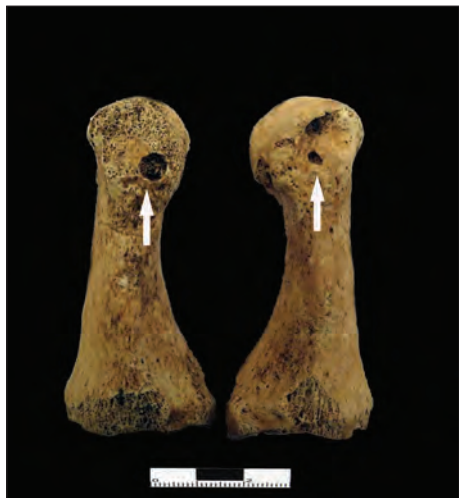
Slika 2: Okrugle erozivne lezije s poroznim dnom i zadebljanim rubovima na medijalnim stranama distalnih trećina prvih metatarzalnih kostiju (palci stopala), najvjerojatnije posljedica gihta; grob 19, stariji muškarac.