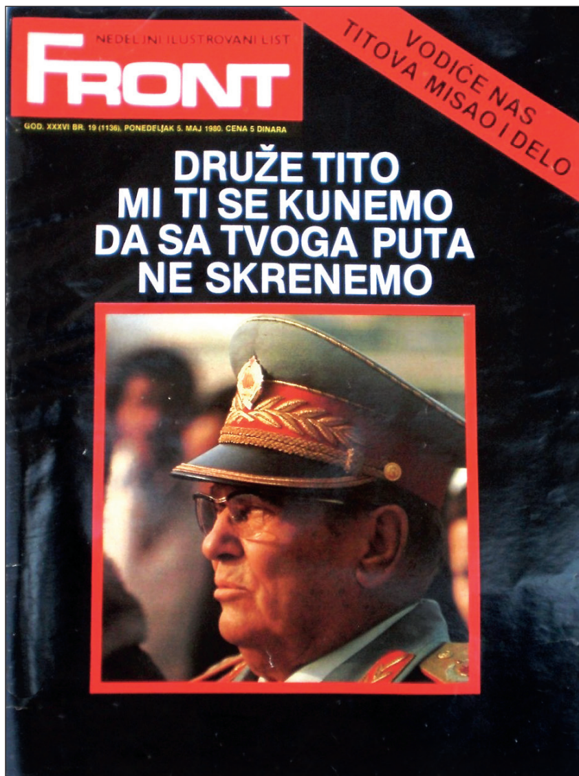
Slika 7: Naslovnica revije Front maja 1980 ob Titovi smrti, ki objavlja moto jugoslovanske pesmi »Druže Tito, mi ti se kunemo, da sa tvoга puta ne skrenemo« (Tovariš Tito, prisegamo ti, da ne bomo skrenili s tvoje poti) v povezavi z napovedjo, da nas bo vodila Titova misel in delo, s čimer se daje prisega, da se bo Titu in jugoslovanstvu sledilo tudi še po njegovi smrti. Pesem se je pela ob prireditvah različnih vrst in je krepila mit o Titu ter jugoslovansko ureditev in vrednote.