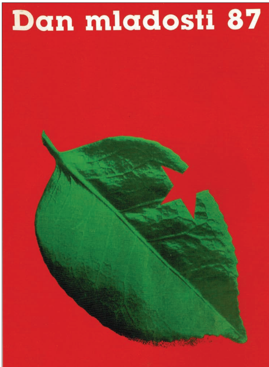
Slika 12: Plakat Studia marketing Delo za Dan mladosti 1987, ki je nadomestil sporni plakat Neue Slowenische Kunst, ki ga je predlagala ZSMS (Repe & Kerec, 2017, 18).