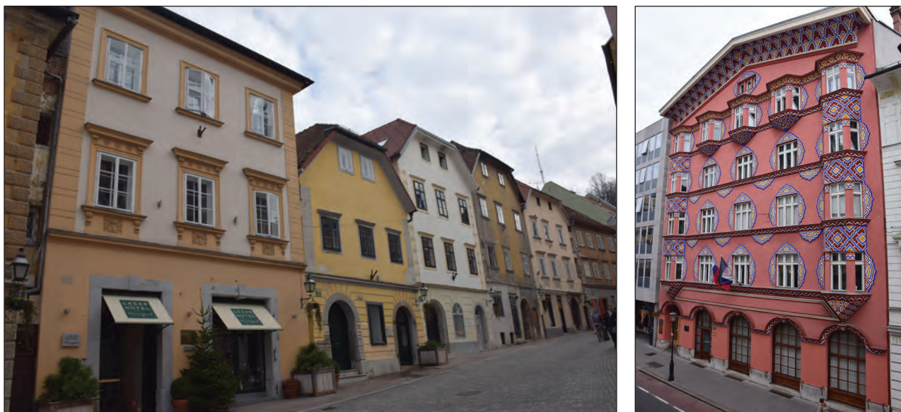
Slika 3: Primeri fasad

gradbenih elementov in slojev v konstrukciji ter odkrivati prisotnost votlin, okvar ali nehomogenosti v materialu. V okviru predhodne analize energetske učinkovitosti stavbe je mogoče z GPR metodo pridobiti podatke o sestavi ovojja in notranjih konstrukcij. Metoda je tudi zelo učinkovita pri ugotavljanju vlažnosti sten in temeljev, saj daje veliko podrobnejše informacije kot vizualna analiza. GPR metodo uporabljajo tudi arheologi pri odkrivanju morebitnih arheoloških ostalin (Komel, 2016).