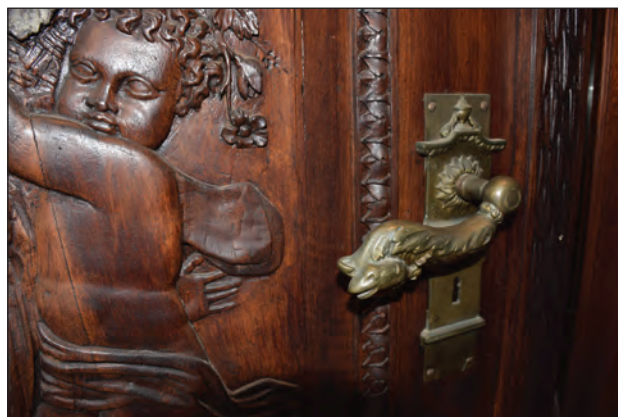
Slika 4: Primeri stavbnega pohištva

Toplotna zaščita zunanjih sten z zunanje strani je v gradbenofizikalnem smislu najprimernejši način, saj zmanjšuje možnost kondenzacije vodne pare na notranjih površinah, zmanjšuje temperaturna nihanja nosilne konstrukcije, povečuje toplotno stabilnost stavbe, izboljšuje zaščito konstrukcije pred padavinsko vlago in zaščito nosilne konstrukcije pred zmrzaljo – saj ta tako ostane v območju nad temperaturo ledišča (Tomšič, 2014). Ukrep je upravičen, kadar na fasadi ni posebnih elementov in je njeno oblikovanje enostavno, ali kadar je večina zunanjega stavbnega ovoja zelo dotrajana in poškodovana (npr. izrazite poškodbe zaradi zamakanja, razpoke, odpadanje ometa, razpad arhitekturnega okrasja in podobno) in se zgolj s popravili ne da več vzpostaviti prvotnega stanja. Ta ukrep je neustrezen za stavbe, kjer je fasada posebej zaščiten zaradi posebnega arhitekturnega oz. zgodovinskega pomena in kjer varovanje obsega tudi prezentacijo izvirnih gradiv. Zaradi naštetih dejstev se na teh stavbah ukrep lahko izvaja samo na stranskih in dvoriščnih fasadah, kar pa zahteva posebno pozornost pri načrtovanju stikov med toplotno zaščitenimi in nezaščitenimi deli (pojav toplotne asimetrije v prostoru, toplotni mostovi). Ukrep je neugoden tudi zato, ker dodana izolacija spreminja prvotni položaj oken in vrat v ravnini zunanje stene, ki je navadno ključen za videz stavbe.