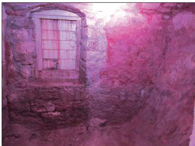
Figure 2: The monastery cell where Blessed Ozana stayed for 52 years (Church of Saint Paul) (Author: Sister Josipa Otahal, Dominican Sisters of the Congregation of the Holy Guardian Angels)

modernističkog diskursa) zahtijeva neprekidnu svijest o tome da je ovakav tip teksta nastajao u vremenu kada se ono što je u njemu prikazano smatralo vjerojatnim i mogućim, nasuprot modernoj čitalačkoj perspektivi u okviru koje koja na ove tektove gleda kao na prostor između čudesnog i natprirodnog. Na drugoj strani, sakralne slike i proročke vizije oblikuju interaktivni kontekst sa hrišćanskim predanjima. A upravo zahvaljujući prisustvu originalno oblikovane fantastičke komponente, koja izvire iz religioznog barkonog misticizma (često izazivanog najstrožijom pokorom i samokažnjavanjem), predanja o Blaženoj Ozani se i svrstavaju u ona djela koja nam mogu ukazati na postojanje izvjesnog otklona od uzora, kako antičkih, tako i italijanskih, pa na kraju i najbližih – dubrovačkih i dalje, dalmatinskih kulturnih i književnih uticaja i doticaja. S tim u vezi, idući tragom Save Damjanova, neophodno je istaći važnost istraživanja fantastičke komponente i fenomena koji, po njegovom mišljenju, predstavljaju „istinsku potrebu, imperative jedne savremenije i modernije književnoistorijske perspektive, koja bi kao relevantne premise podrazumevala aktualizujuću recepciju, osavremenjavanje istorije i oživljavanje tradicije, i koja bi bila zasnovana na otkrivalačkoj tenziji, na pokušaju premošćavanja