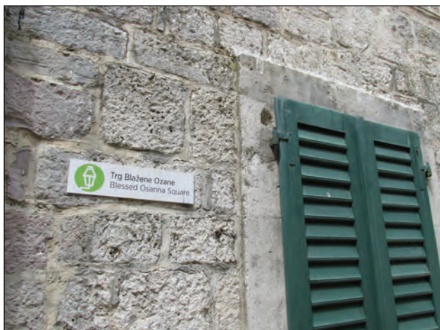
Figure 6: Blessed Osanna Square in Kotor (Author: Sister Josipa Otahal, Dominican Sisters of the Congregation of the Holy Guardian Angels)

identiteta«, koji bismo produktivno mogli primijeniti upravo na ovo predanje. On ističe da: „Izabirati i oblikovati identitetske figure znači, baš poput Janusa, ne gubiti iz vida zadanost prošlosti, upravljati počecima – ne svih „stvari“, nego onih vlastitih“ (Zeman, 2007, 1027).