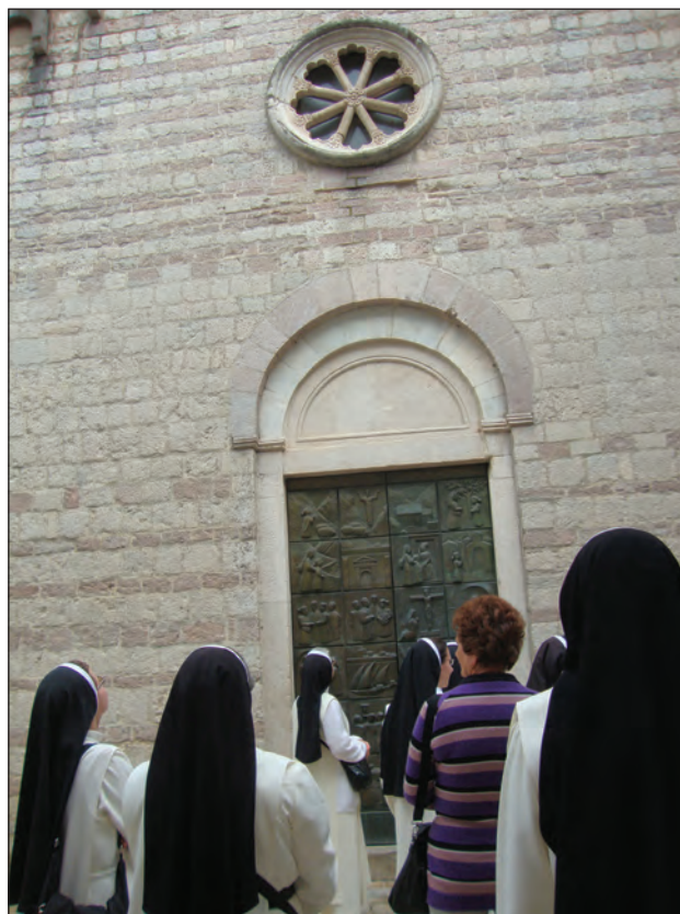
Figure 3: Dominican Sisters of the Congregation of the Holy Guardian Angels in front of the church of St. Mary Collegiata in Kotor (Blessed Ozana Church)

Jedna suvremena perspektiva čitanja nam omogućuje ne samo uvid u specifičnosti poetskog izraza kotorskog areala u vrijeme barokne stilske formacije, već i stavljanje kulturnih ostvarenja (ne samo književnih) u kontekst južnoslavenske, mediteranske, pa i europske književne ostavštine; čime se ispoljena obilježja mogu posmatrati sa stanovišta njihove re-aktuelizacije i re-afirmacije.