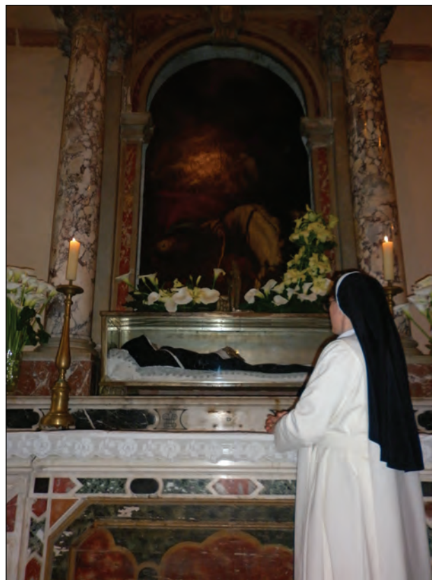
Figure 5: Dominican Sister in front of the relics of Blessed Ozana

Sakupljanjem građe, interpretacijom činjenica i događaja, prerađivanjem mnemoničkog materijala, projekcijama dijahronijski promatranih tekstova kulture, dolazi do oblikovanja lika Blažene Ozane Kotorske u vidu snažnog semantičkog jezgra u sistemu crnogorske kolektivne memorije. Ako pođemo od Lotmanove tvrdnje da je za onoga ko ga usvaja, tekst svojevrsna metonimija integralnog značenja koje se rekonstruiše, suočavamo se i sa činjenicom da je „zbir konteksta u kojima dati tekst stiče osmišljenost i koji kao da su na neki način inkorporisani u njega“ (Lotman, 2004, 27) zapravo ono što nazivamo pamćenjem teksta i njegovim smisaonim prostorom . S obzirom na to da kulturalni pristup književnim ostvarenjima crpi svoja značenja iz uspostavljenih interakcijskih relacija između književnog teksta i kulture, on neminovno teži sinkretizmu i samih identitetskih predstava. Jer, posmatramo li predaju o Blaženoj Ozani „s motrišta pamćenja“ možemo uvidjeti da se ono postavlja „kao mnemotehnička umjetnost par excellence jer utemeljuje pamćenje kulture; bilježi pamćenje kulture; ona je čin pamćenja; upisuje se u prostor pamćenja koji se sastoji od tekstova; kreira prostor pamćenja u kojemu se tekstovi-prethodnici preuzimaju preko stupnjeva transformacije“ (Lachmann, 2002, 209). Sukladno tome, kulturalnomemorijsko