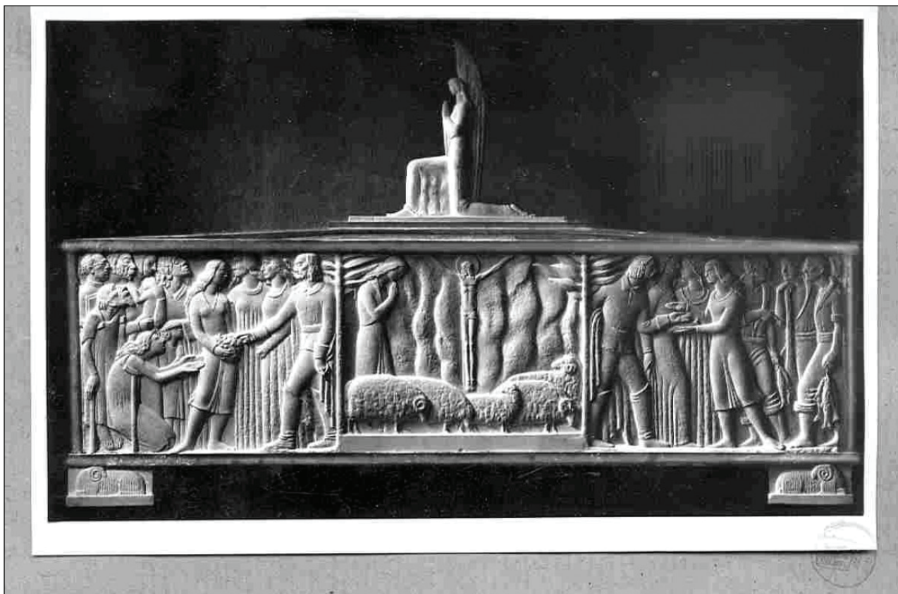
Figure 4: The sarcophagus of Blessed Osanna of Kotor by Antun Augustinčić