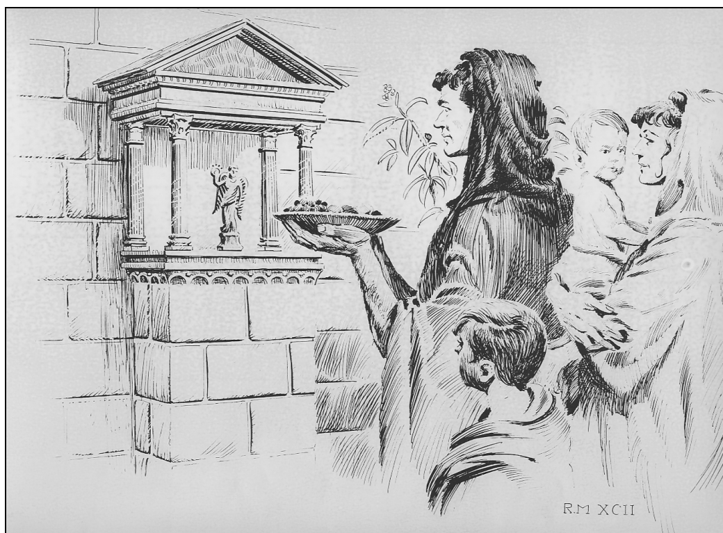
Sl. 8: Imaginarna risba Viktorije, boginje zmage (gr. Nike) v hišnem oltarju lararija iz prve polovice 1. stol. Fig. 8: Imaginary drawing of Nike, the goddess of victory, in house altar of the shrine of the lares from the first half of the 1 st century.

1993). Živalske ostanke, ki so bili odkriti v stratigrafskih enotah bivalnih prostorov, lahko povežemo s prehranjevalnimi običaji družbe, ki je tu živela (Ganderton, 1981, 17), rastlinske pa s takratno vegetacijo.