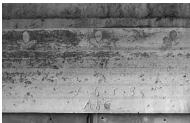
Sl. 7: Portal – detajl preklade z letnico in inicialkama A C.