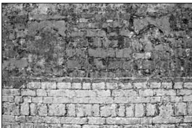
Sl. 3: Južna stena ladje z zazidanima prvotnima oknoma.

Fig. 3: The southern wall of the nave with two windows now walled-up.