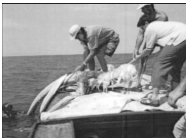
Sl. 3: Dvig spodnje čeljustnice z morskega dna. V predelu spodnječeljustnične glave je še veliko mehkega tkiva.

Izkušnje, pridobljene ob dviganju spodnjih čeljustnic, so pokazale, da je pri drugih kostnih elementih smiselno počakati do konca razpada. V naslednjem mesecu je zaradi visokih temperatur truplo hitro razpadalo, zato je potapljaška ekipa ocenila, da bo oktobra od živali ostalo samo še okostje. Zaradi izkušenj, pridobljenih ob dvigu spodnjih čeljustnic, se je PMS vendarle odločil, da bo okostje dvignil zgodaj spomladi 2004. Če bi se namreč ob dvigu pokazalo, da razkroj še ni povsem končan, bi to povzročilo veliko težav in dodatnih stroškov. Poleg tega tudi sredstva, ki jih je imel PMS na voljo v letu 2003, niso omogočala obsežnejšega nadaljevanja del.