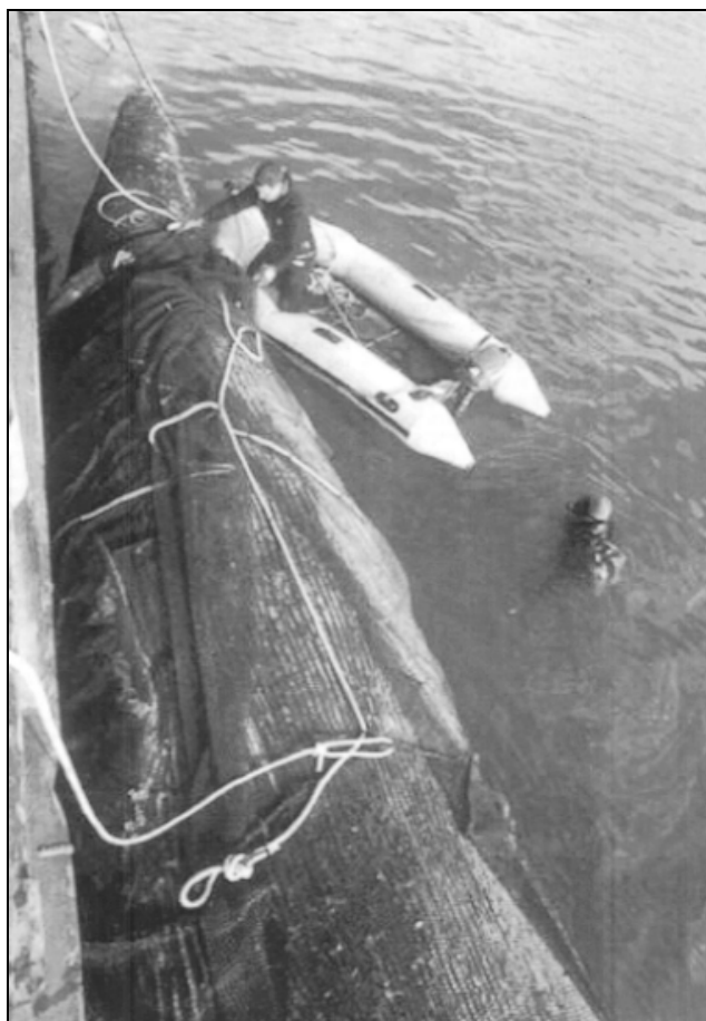
Sl. 2: Ekipa Uga Fonde v koprski luki ovija brazdastega kita v mrežasto vrečo.