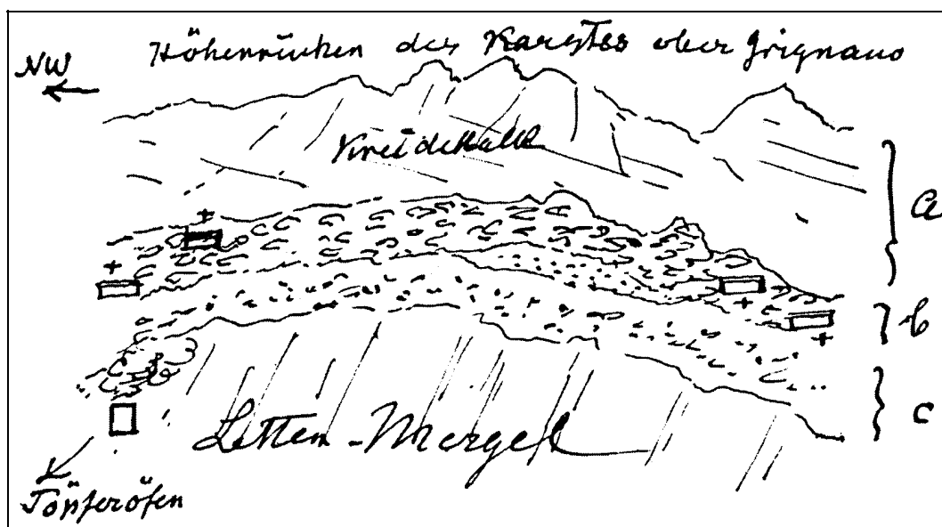
Carta 8: Lahovec. Schizzo di L. K. Moser (ÖSAW) del sito archeologico nella vigna di A. Gorjup con legenda: a) Karstkalk; b) Kalksschutt mit schwarzen Humus m. Gräbern; c) Kalkschutt z. Th in Terra rossa verwitter.

Karta 8: Lahovec. Skica (L. K. Moser) arheološkega najdišča v vinogradu A. Gorjupa (ÖSAW).