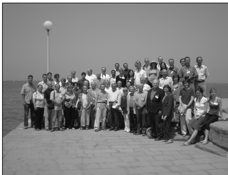
Slika 1: Participants of the 10 th International Symposium on Neuropterology.

The number of participants was higher than any recorded during the previous Symposia. Piran was an enchanting site and the convivial events (get together party at the Marine Biology Station, social dinner and excursions) received high praise from participants. Taking into account the number of participants at the Symposium,