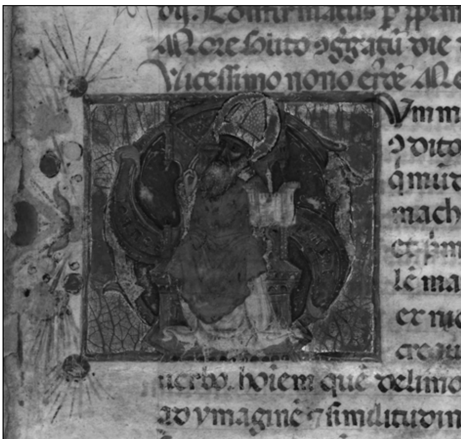
Sl. 1: Ivan Ugrinović, inicijal s likom Sv. Vlaha. Dubrovački statut iz 1272., službeni prijepis iz 1432. (DAD, 11, f. 5r).