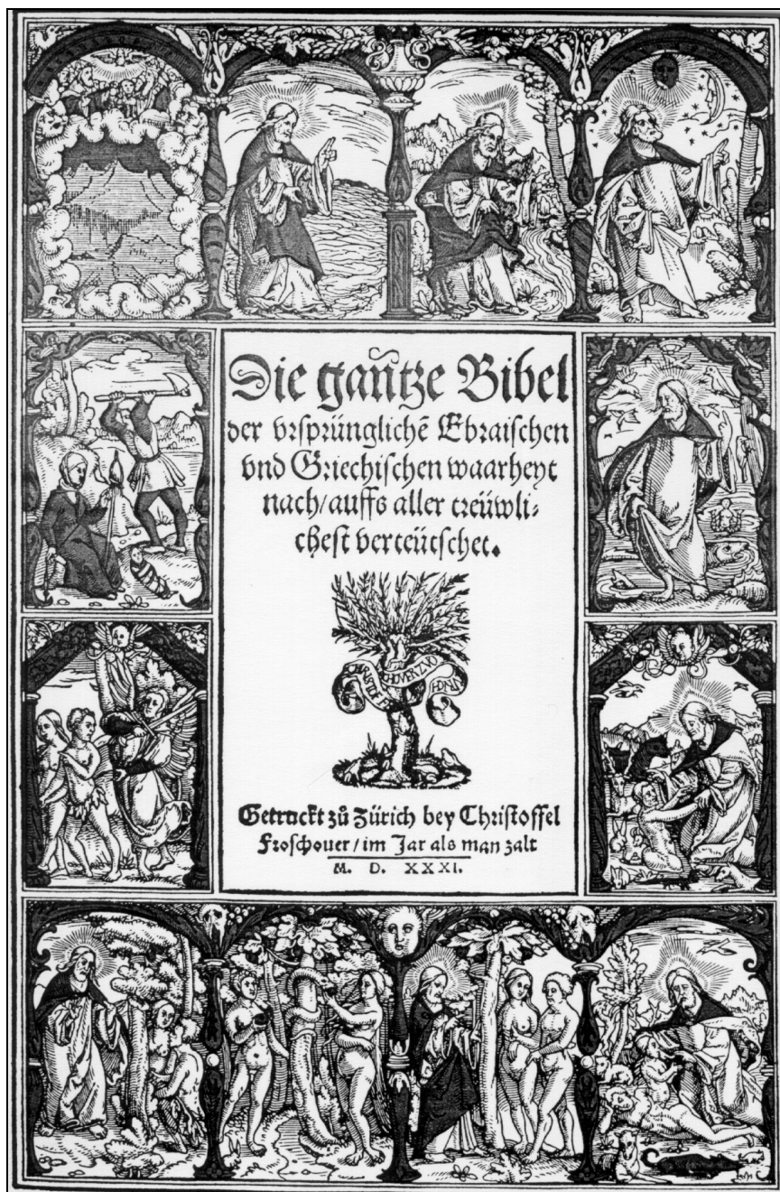
Slika 2: Huldreich Zwingli Die ganze Bibel.