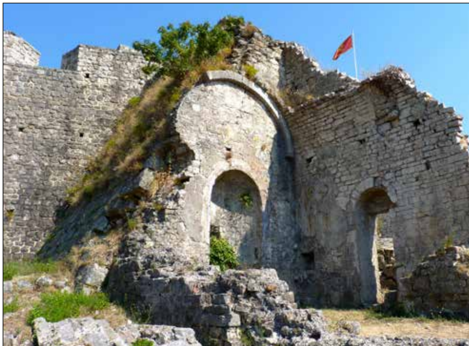
Stari grad Bar: ruševine franjevačkog samostana sv. Nikole i crnogorska zastava na Citadeli.