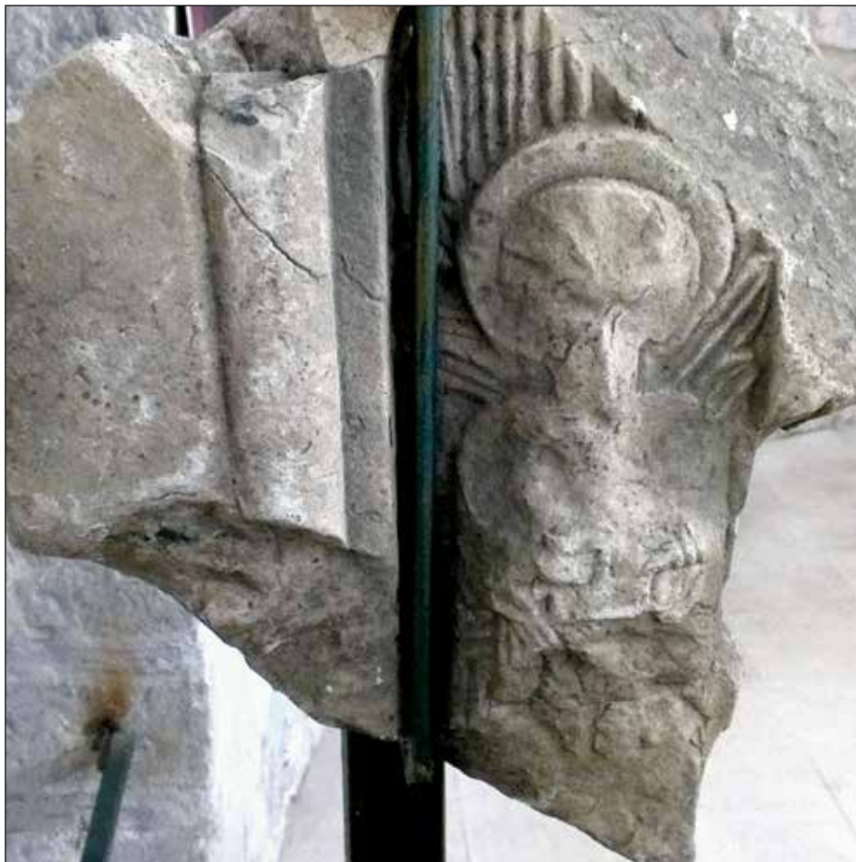
Dio dovratnika s portala katedrale sv. Đura čija se simbolika dovodi u vezu sa sv. Matejem