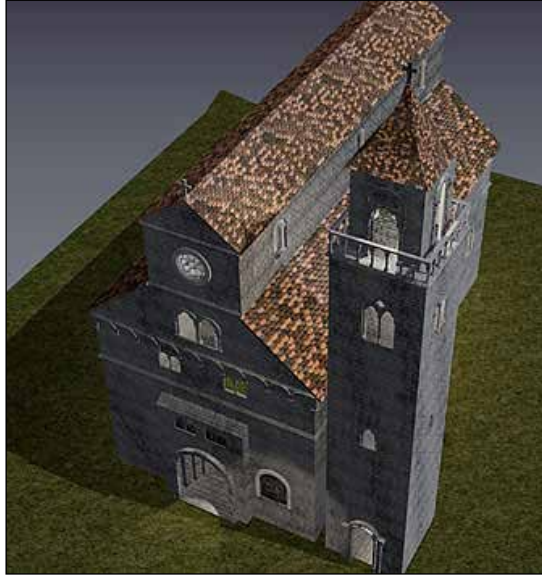
Bar, katedrala sv. Đura (Đorđa), XVI st.