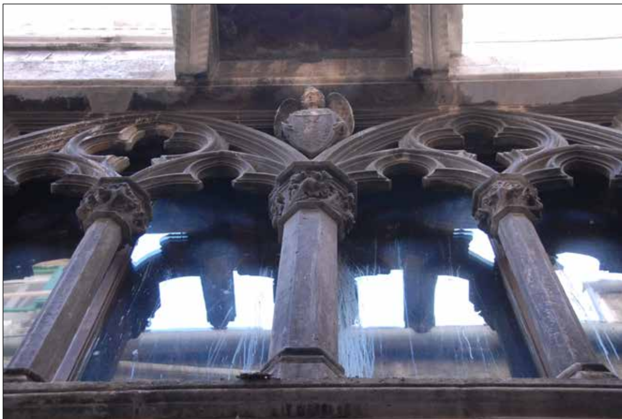
Slika 2: Split, Papalićeva palača, detajl kvadrifore Figure 2: Split, Papalić Palace

1440, kot je zapisano v eksplicitu (Brunelli, 1879–1882, III, 36; Caglioti, 1996, 212: n. 18). V njegovem času je bilo v veliki meri zaključeno pritličje s preddverjem, ki je obsegalo pet stebrov in dva polstebra s kapiteli, od katerih je bil na enem upodobljen Eskulap, na enem pa Salomonova sodba (Brunelli, 1879–1882, I, 41–42). Iz opisa lahko sklepamo, da je bilo preddverje umeščeno podobno kot danes, torej med dva vogalna stolpa. Kapitel z Eskulapom se najverjetneje nahaja na svojem prvotnem mestu, torej na steni jugozahodnega vogalnega stolpa, kapitel s Salomonovo sodbo, ki naj bi se glede na Diversijev opis nahajal pred vhodom v Knežev dvor, pa je danes shranjen v mestnem muzeju.