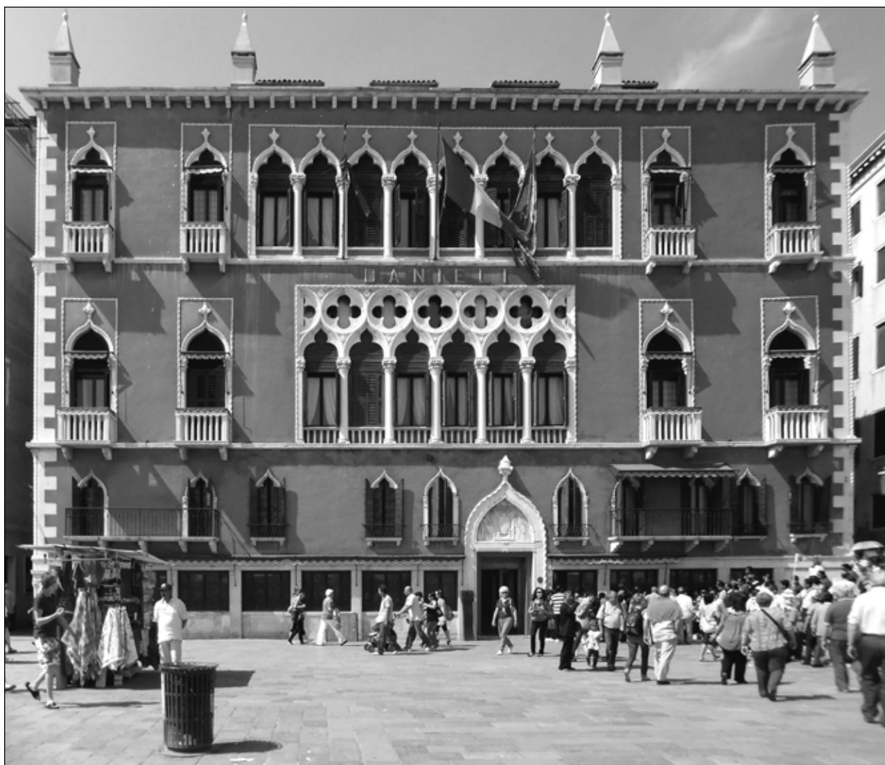
Slika 5: Benetke, Palazzo Dandolo, druga polovica 15. stoletja Figure 5: Venice, Palazzo Dandolo, second half of the 15th century

poznamo le višine posameznih delov: stebri brez kapitelov so bili visoki nekaj več kot tri metre, krogovičja dva metra in križne rože en meter. Skupna višina teh elementov ter kapitelov, baz in velike figure Hektorja bi lahko dosegla tudi osem metrov, vendar pa to, če fasado primerjamo npr. z drugim nadstropjem Ca' d'Oro, niti ni nujno, saj je osrednja polifora lahko bila nižja od stranskih monofor. Podatek, da je bila trifora, ki se je v posameznih elementih morala ujemati s kvadriforo in saracenskima oknom, izdelana za stolp z zvonom, nam pove, da so bila okna nameščena na zahodni fasadi. V literaturi je bil do nedavna kot stolp z zvonom prepoznan jugovzhodni stolp pri vratih Ponte (Beritić, 1955, 28; Grujić, 2003–2004, 156), vendar pa dokument z dne 8. aprila 1442 (Folnesics, 1914, 190–191; Novak Klemenčič, 2006, 243; Grujić, 2008, 39: dok.