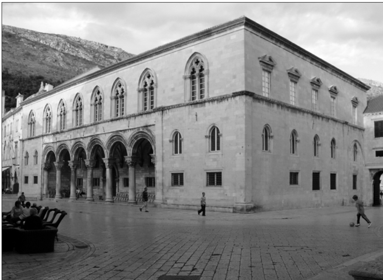
Slika 1: Dubrovnik, Knežev dvor Figure 1: Dubrovnik, Rector's Palace

Pri rekonstrukciji zahodne fasade Kneževega dvora, ki gleda na glavni trg, se lahko naslonimo na Opis Dubrovnika Filippa Diversija, ki je bil zaključen januarja