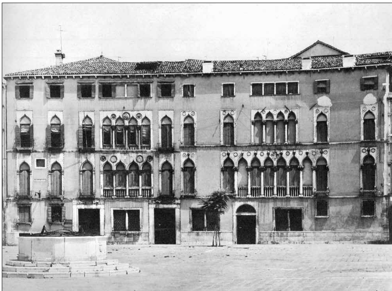
Slika 4: Benetke, Palazzo Soranzo a San Polo, leva polovica 14., desna 15. stoletje Figure 4: Venice, Palazzo Soranzo a San Polo, 14th and 15th centuries

Par saracenskih oken je bil v primerjavi z drugimi okni Kneževega dvora res izjemen. Okni sta od najnižje konzole do vrha križne rože merili kar 31 dlani, torej skoraj osem metrov. Krasila sta jih balkončka z balustradama, krogovičji sta bili zaključeni z veliko križno rožo, okrašeni pa sta bili z vegetabilnim in figuralnim okrasom. Kot kaže pa okni tudi nista bili iz običajnega apnenca s Kamenjaka, saj je v dokumentu zapisano, naj se pri izdelavi oken uporabi kamne, kot so zapisani na risbi (»le piere che vol alle dette fenestre se intenda no secondo stano scritte allo desegno«). Domnevamo lahko, da se je zapis nanašal na kamne različnih barv, kar je primerljivo s saracenskimi okni beneške palače Ca' d'Oro, ki je bila zgrajena med leti 1421 in 1437 (sl. 3; Goy, 1992; Rössler, 2010, 172–183). Okna na Ca' d'Oro so bila poslikana in pozlačena, o čemer pri obeh dubrovniških monoforah nimamo podatkov, vendar pa vemo, da so tudi v Dubrovniku v posebnih primerih zla-