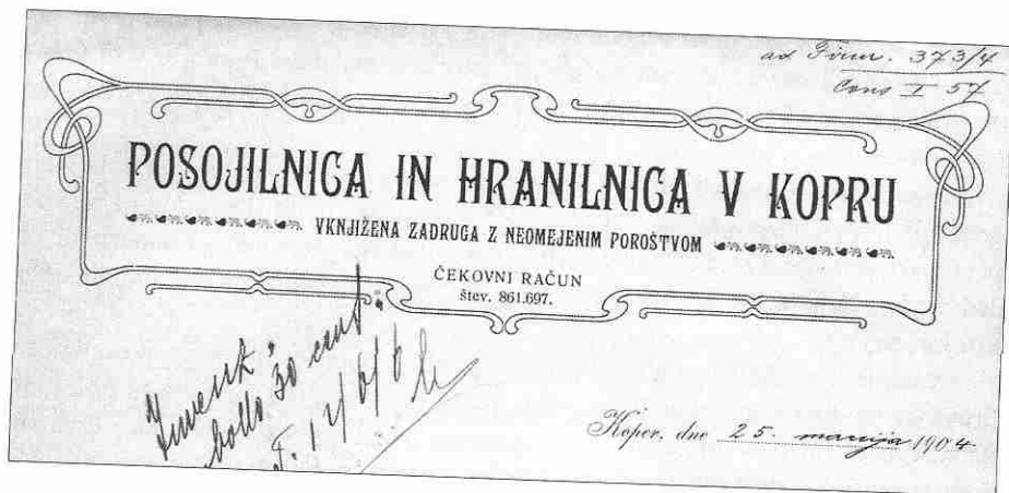
Sl. 1: Glava dopisa Posojilnice in hranilnice Koper, 1904 (PAK, 18).