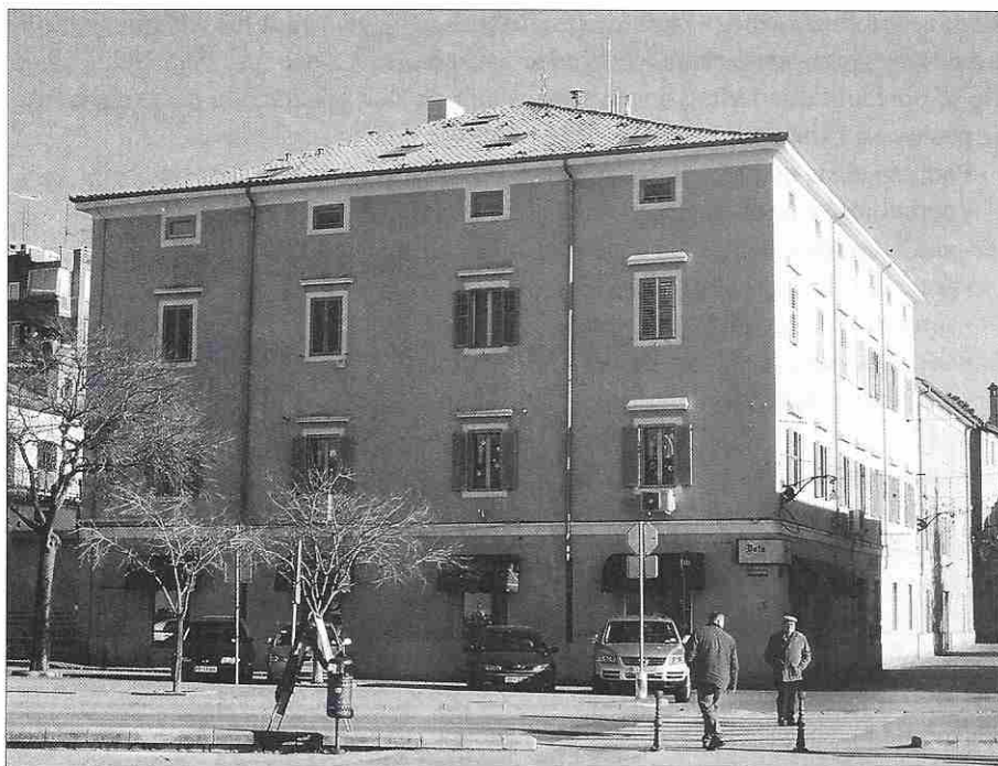
Sl. 6: Stavba sedeža Istrske banke na Santorijevi 28/II (danes Kidričeva ulica).