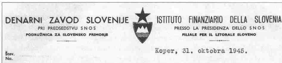
Sl. 3: Glava dopisa Denarnega zavoda Slovenije, podružnice za Slovensko primorje, 1945 (PAK, 17).

Predsedstvo SNOS je dne 12. marca 1944 izdalo Odlok o ustanovitvi Denarnega zavoda Slovenije (UL SNOS, 1944, 1/6) z nalogo, da zmanjša valutno zmedo, zagotovi zadostno količino denarnih sredstev za potrebe narodnoosvobodilnega gibanja in uredi finančni položaj. Septembra istega leta je Denarni zavod Slovenije (DZS) ustanovil podružnico za Slovensko primorje.